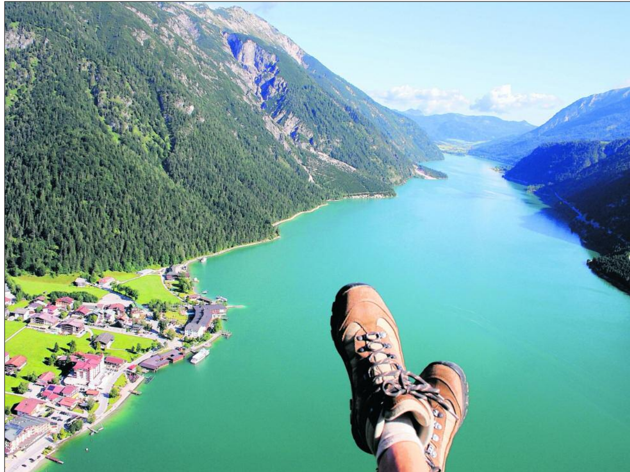
Die übereinandergeschlagenen Füße des Gleitschirmpassagiers signalisieren seelische Ausgeglichenheit beim Flug über den Tiroler Achensee, auch wenn am Start die Knie butterweich waren.

Zunächst legt der Adler den Rückwärtsgang ein. Der Blick fällt ins Tal, während man sicher befestigt an einem 800 Meter langen Stahlseil zum 200 Meter höher gelegenen Gschöllkopf gezogen wird. Dann geht's richtig los: Mit rund 85 Kilometern pro Stunde rasen die Passagiere zum Ausgangspunkt an der Bergstation der Rofanseilbahn zurück. „Viele schauen erst einmal zu, bevor sie