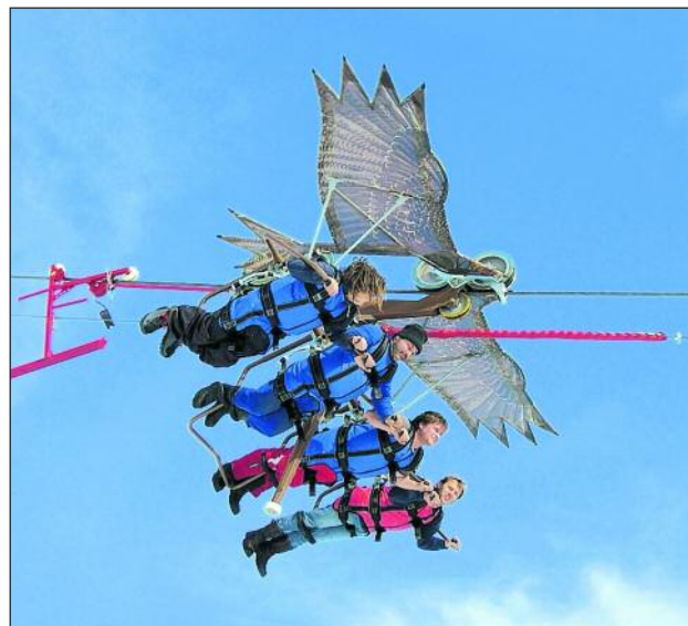
Sicher am Stahlseil hängend geht es mit Tempo 85 bergab. Beim Skyglider Airfan wird jede Menge Adrenalin freigesetzt.