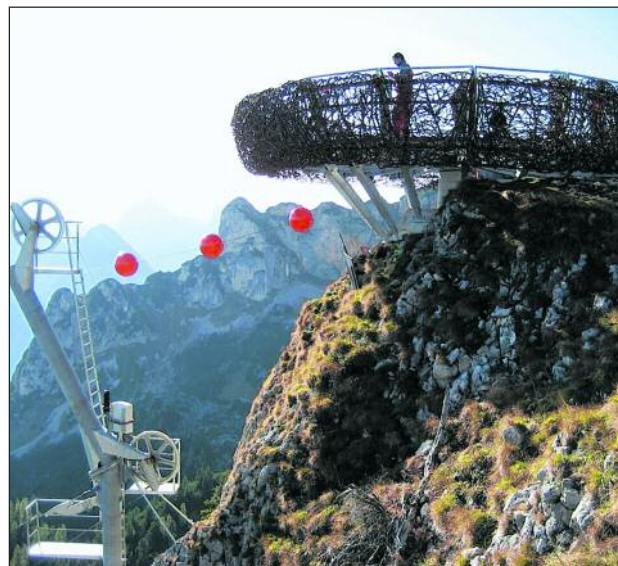
Ein bisschen Peking in den Tiroler Alpen: Der Aussichtspunkt Adlernest ist einer der Höhepunkte des Weitwanderwegs Adlerweg.