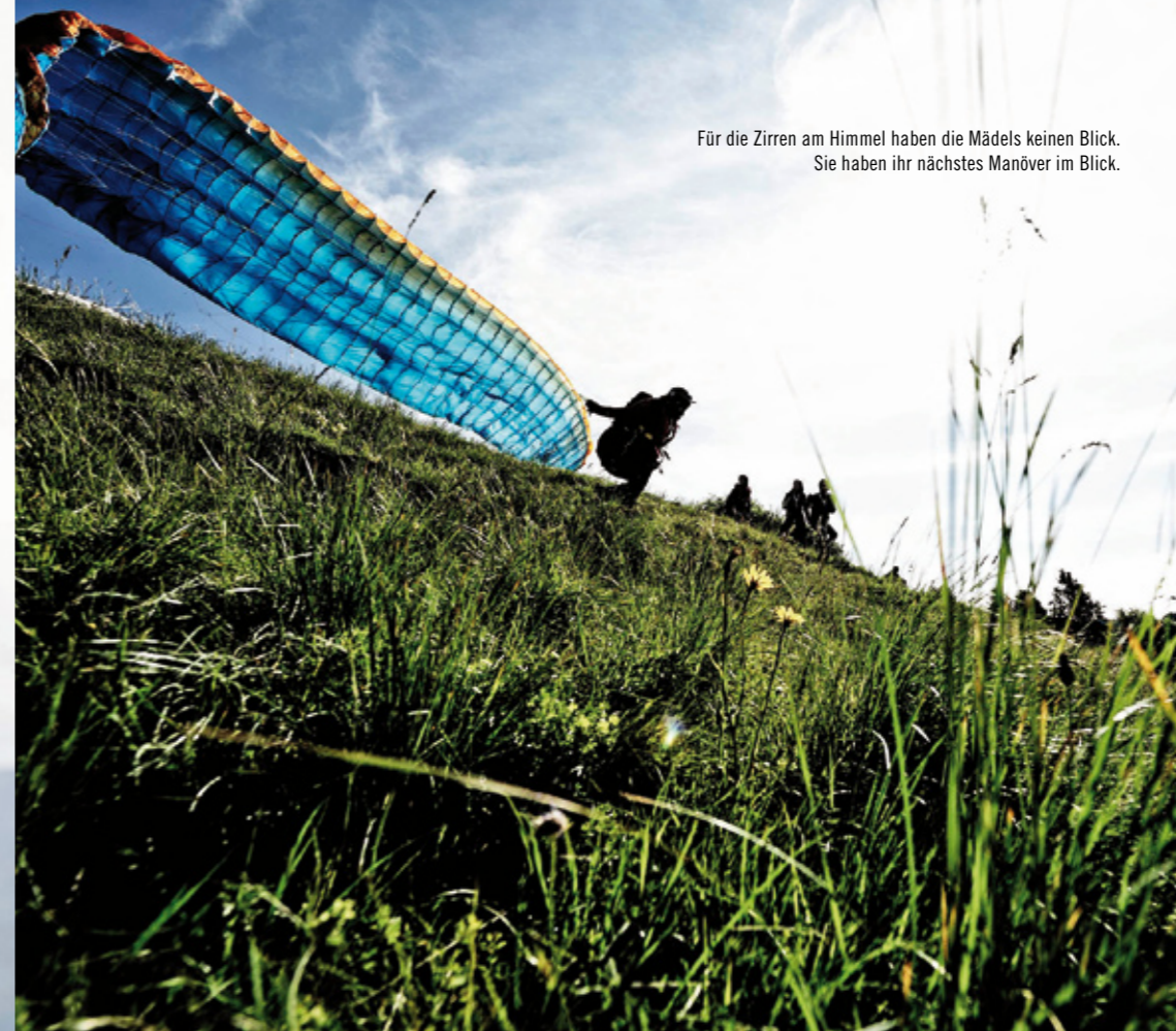
Für die Zirren am Himmel haben die Mädels keinen Blick. Sie haben ihr nächstes Manöver im Blick.

Vor dem eigentlichen Start steht aber erstmal wieder ein Aufwärmtraining an. Anschließend geht dann alles sehr schnell. Sämtliche Pilotinnen sind hoch motiviert. Die am Vortag geübten Manöver werden nur so runtergespult. Jede gibt ihr Bestes. Die beiden Punkterichter, zwei angereiste Airwave-Testpiloten, staunen, was man in zwei Tagen alles trainieren kann.