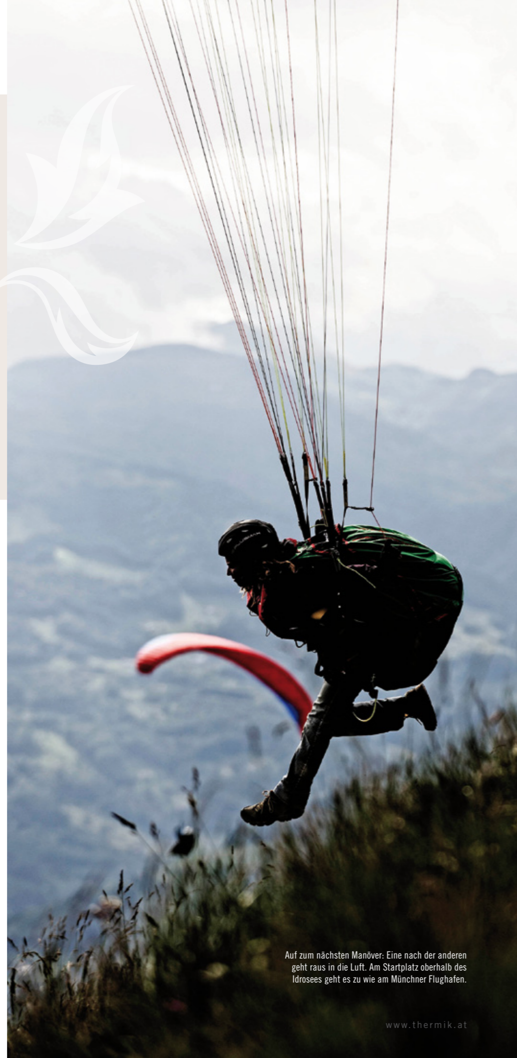
Auf zum nächsten Manöver. Eine nach der anderen geht raus in die Luft. Am Startplatz oberhalb des Idrosee geht es zu wie am Münchner Flughafen.